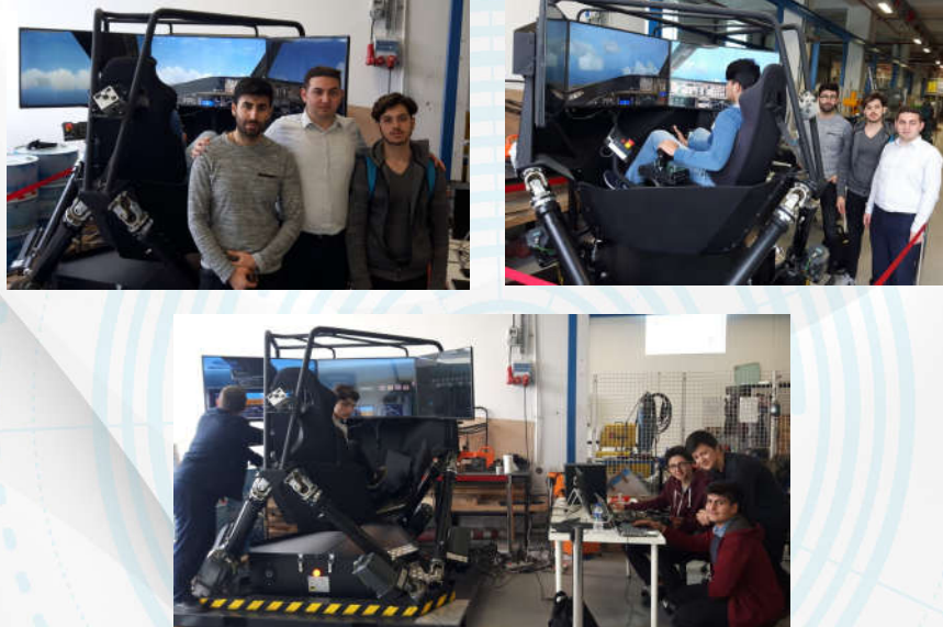
TÜGVA Hazerfan Uçuş Eğitimi Projesi